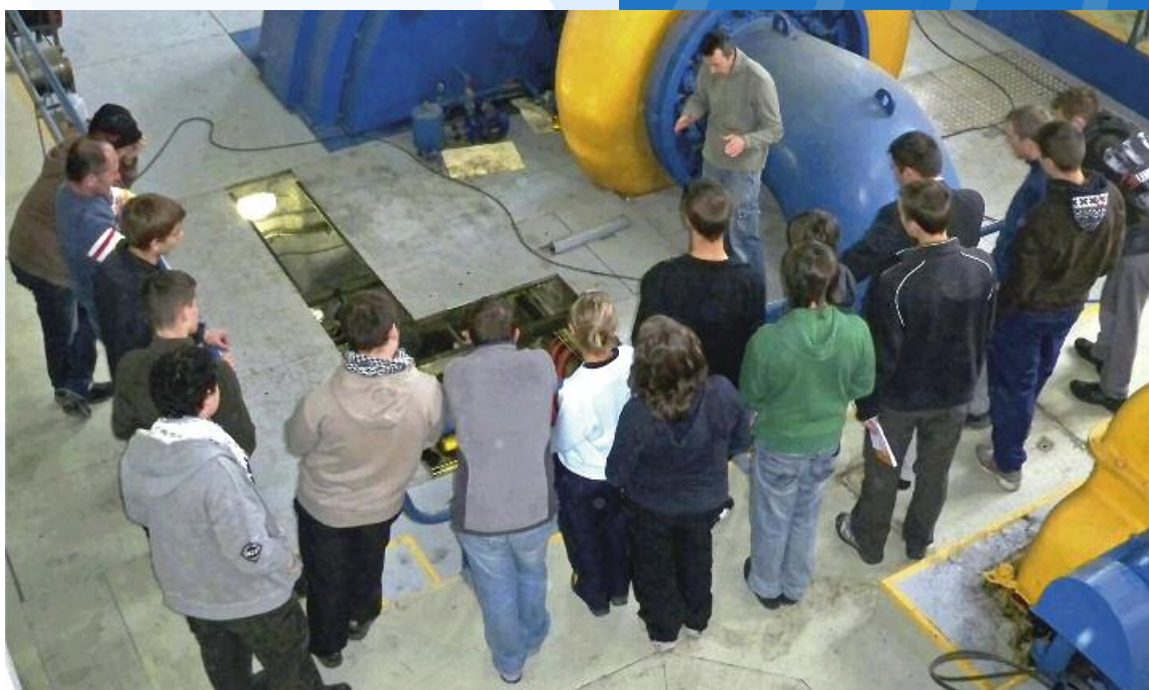
Illustration avec la photo ci-contre : cette classe est venue spécialement du Lycée Imbert de Sarre Union, en Alsace, pour visiter notre usine de production d'électricité de Pont-Baldy.

Enfin, nous collaborons localement avec le CISPD (Conseil Intercommunal de Sécurité et de Prévention de la Délinquance) pour aider à la réinsertion des jeunes, parfois en rupture avec le milieu professionnel, en leur confiant la réalisation et la responsabilité de menus travaux (espaces verts, peinture...).