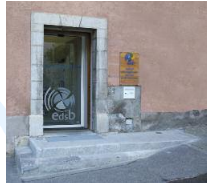
La nouvelle entrée d'EDSB