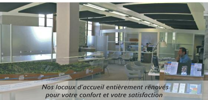
Nos locaux d'accueil entièrement rénovés pour votre confort et votre satisfaction