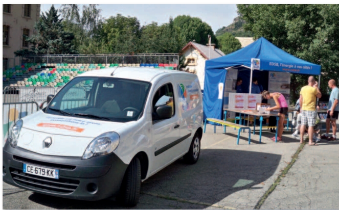
Ci-dessus : le véhicule électrique d'EDSB qui a ouvert la course, devant le stand d'EDSB

Enfin, quelques salariés ont porté le maillot de l'entreprise sur le semi-marathon.